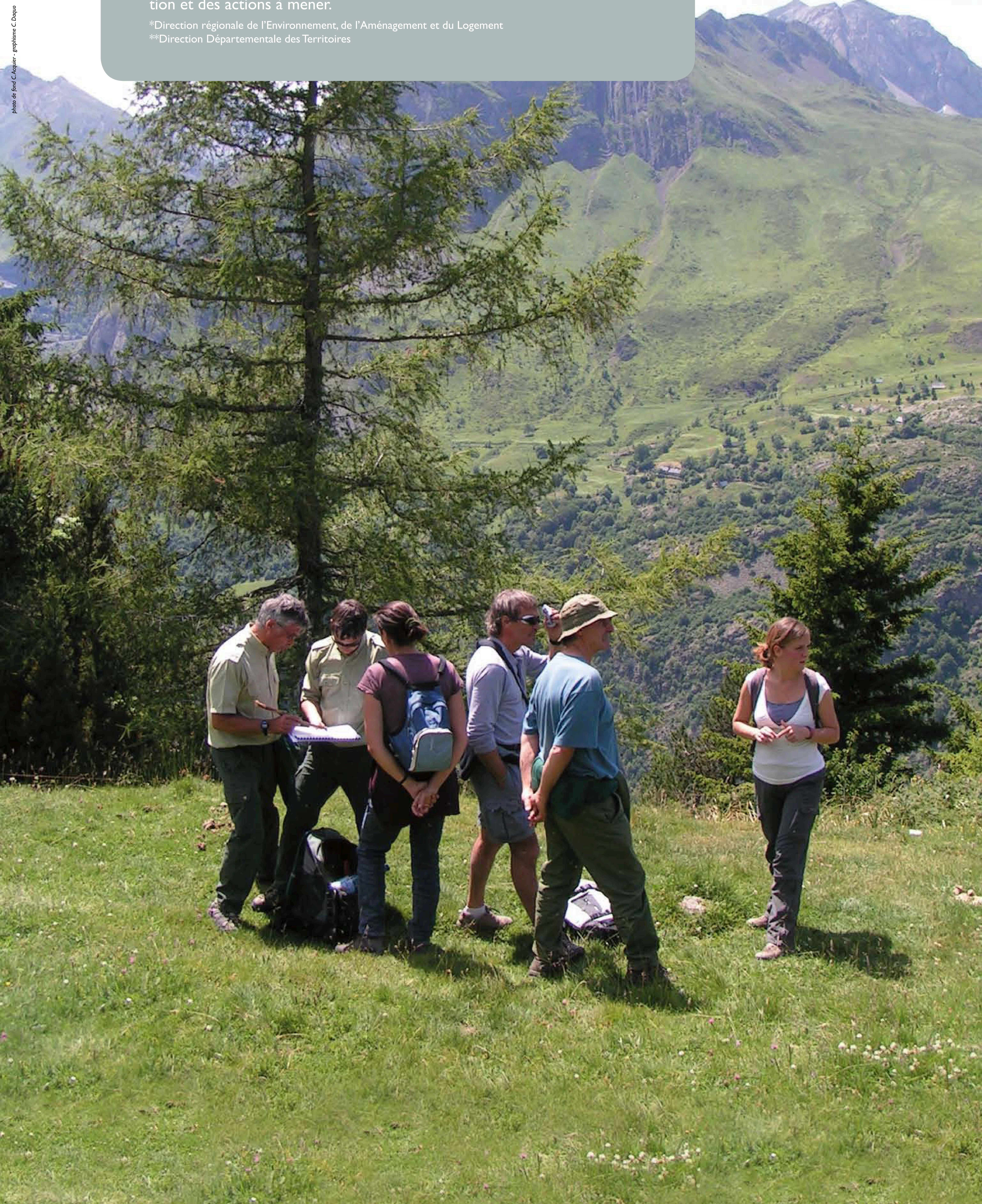
Ci-dessous Concertation sur le terrain