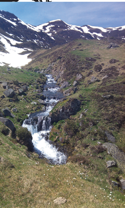
Estive d'Ourrec