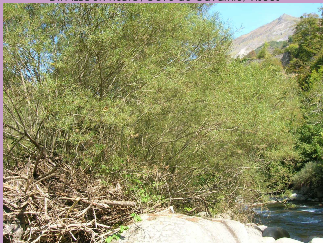
D.FALLOUR-RUBIO, Gave de Gavarnie, Viscos

Cet habitat est présent en Europe dans les régions biogéographiques arctico-alpines. En France, il est présent au niveau des cours d'eau torrentiels, essentiellement sur les parties hautes et moyennes des massifs montagneux les plus importants : Alpes, Pyrénées, ainsi que Cévennes et Jura. Il descend également en plaine au niveau de certaines parties des bassins du Rhône et de la Garonne, autrefois du Rhin et sur les torrents soumis au régime méditerranéen. En Midi-Pyrénées, on le trouve notamment dans les parties amont à moyenne des bassins de la Garonne, de l'Ariège, des Nestes, de l'Hers et des Gaves. Il est plus rare ou absent sur le bassin de l'Adour.