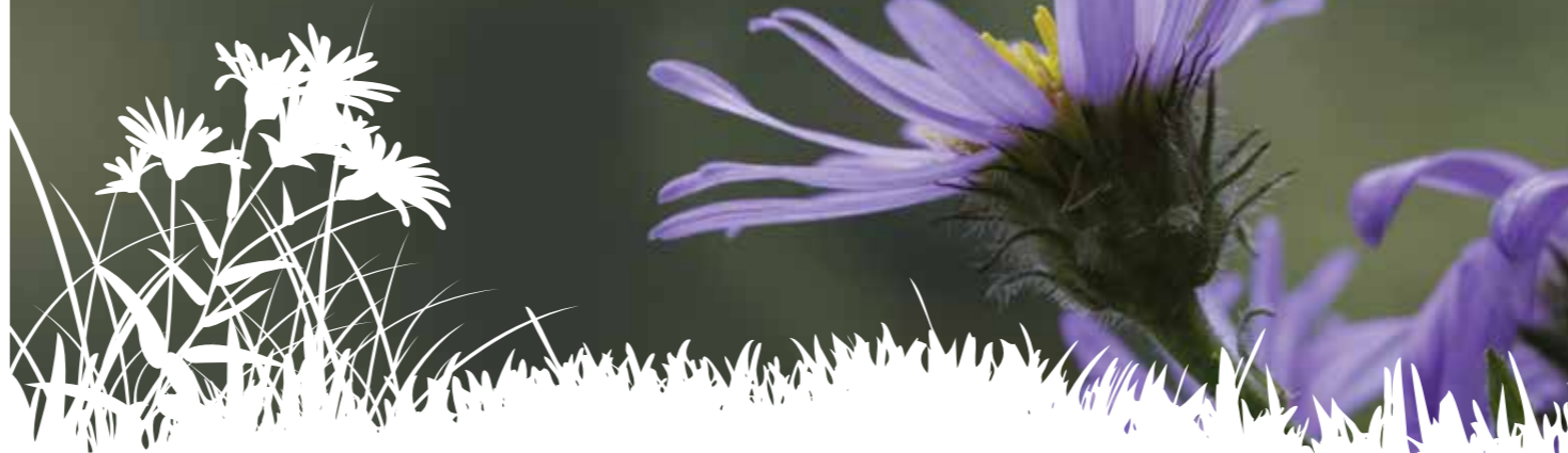
Asters des Pyrénées