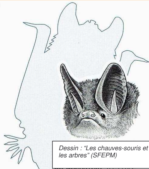
Dessin : "Les chauves-souris et les arbres" (SFEPM)

En France, il est présent dans presque tous les départements mais il est en général peu représenté et est très rare sur la bordure méditerranéenne.