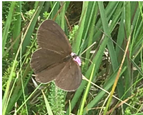
Fadet des laïches, 05/07/2021