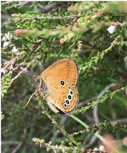
Fadet des laïches mâle, 25/06/2021