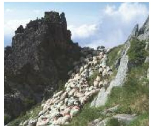
Estive de labasse - Cipièr, ► CRPGE