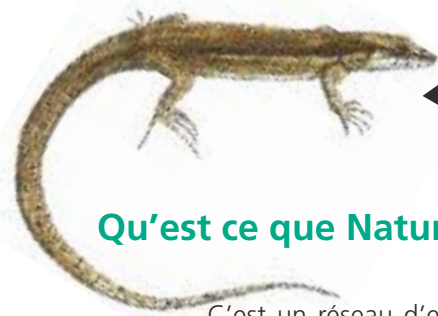
◀ Lézard des Pyrénées