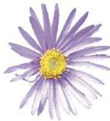
◀ Aster des Alpes - Loustalot Forest,

Pour nourrir les réflexions d'ordre technique, le Comité de pilotage désigne des groupes de travail réunissant des experts, techniciens, usagers, propriétaires... Animés et réunis par l'opérateur, leur rôle est de faire en sorte que la réflexion soit le plus en adéquation avec la réalité du terrain. Ils sont ouverts à toute personne qui souhaite s'impliquer dans l'élaboration du Document d'objectifs et se réuniront à partir du printemps 2009.