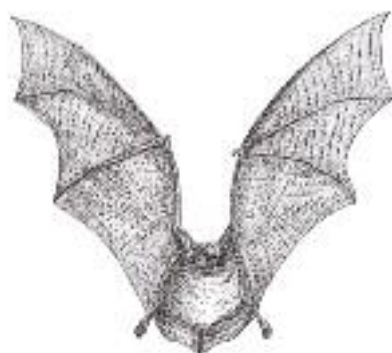
◀ Petit Murin