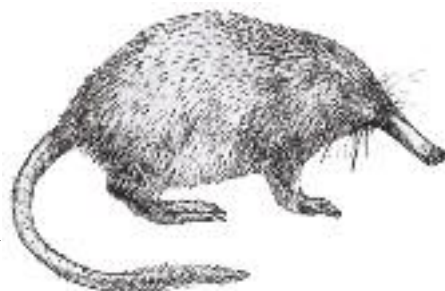
Desman des Pyrénées ▶