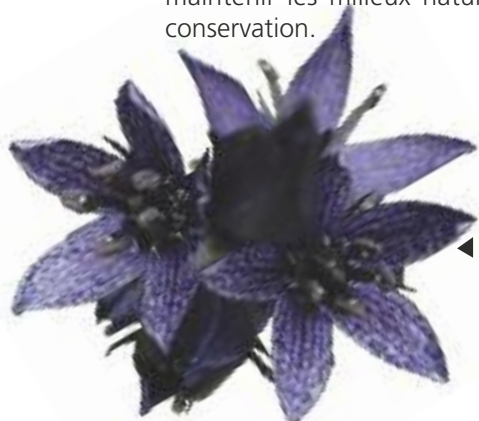
◀ Swertie vivace

Ainsi chaque site Natura 2000 sera doté d'un Document d'objectifs ou « DOCOB » . Ce document est, en fait, une sorte de plan de gestion qui identifie les priorités de conservation, les exigences socio-économiques locales, fixe les orientations de gestion en fonction des objectifs définis en commun par tous les acteurs du site, et identifie des moyens financiers d'accompagnement des mesures de gestion permettant pour maintenir les milieux naturels et les espèces en bon état de conservation.