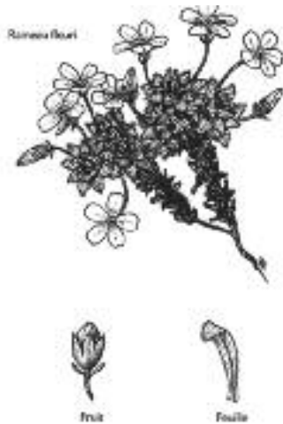
▲ Androsace des Pyrénées