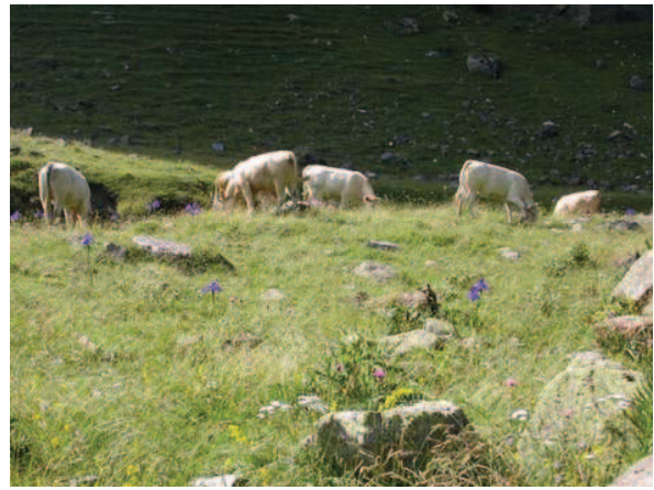
CADARS D. , la Céla

Alliance : Potentillo-Brachypodium pinnati