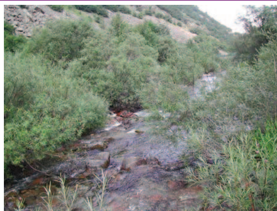
CELLE.J. (PNP). Gave de Héas