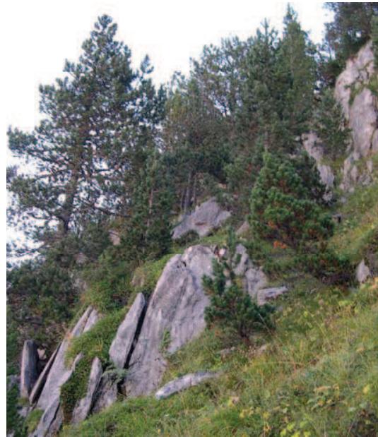
MARTIN D.- Pineriaie sur calcaire, Pouey Arraby