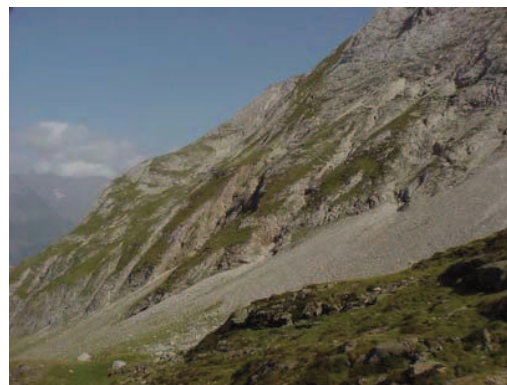
MARTIN D.- Eboulis calcaire sous le Soum Blanc