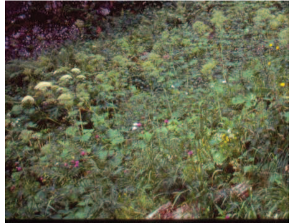
LE MOAL T. - Ravin de la Glacière