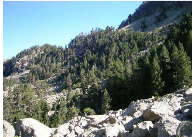
LE MOAL T. - Pouey-trénous

Statut : intérêt communautaire – 9430-12