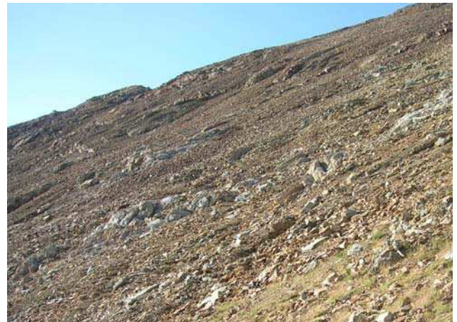
LE MOAL T. – Crête du petite Vignemale

Statut : intérêt communautaire 8130-13 et 8130-16