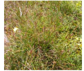
LEMOAL T., 2004 – Kobresia simpliciuscula