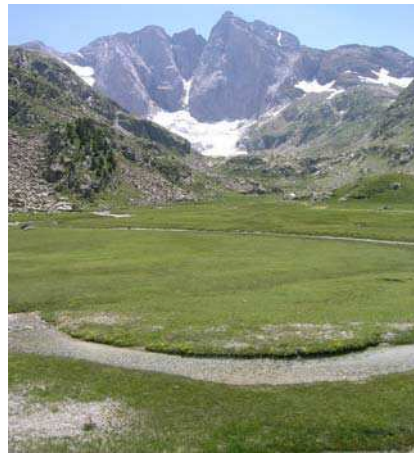
BULIARD Y., 2004 – Les petites Oulettes

Statut : intérêt communautaire prioritaire – 7240-1*