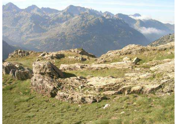
LE MOAL T...- Cuyéou Bielh

Statut : intérêt communautaire prioritaire – 6230 - si riche en espèces -