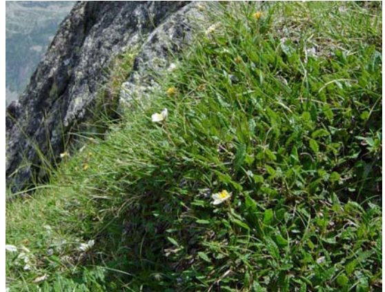
LE MOAL T. - Mount det Liou