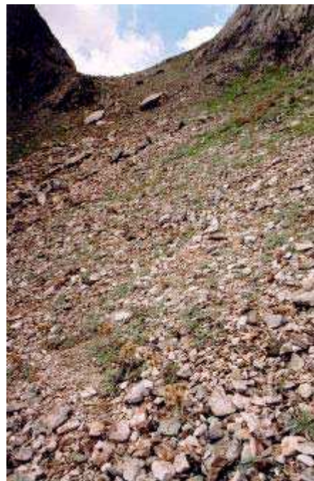
LE MOAL T. - Vallon de la Fache

Statut : intérêt communautaire 8130-13 et 8130-16