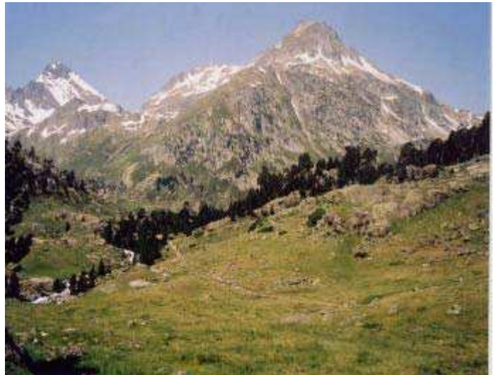
LE MOAL T. - Plateau du Marcadau

Statut : intérêt communautaire prioritaire – 6230 - si riche en espèces -