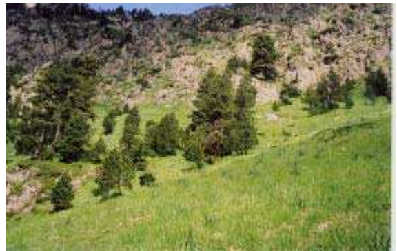
LE MOAL T. - Soula