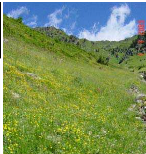
LE MOAL T. - Lit Sarrouère