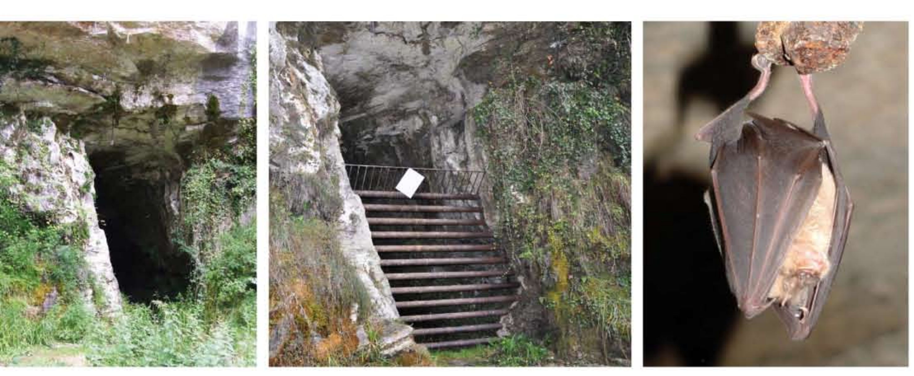
Le site compte plus de 700 cavités naturelles. Certaines abritent des colonies de chauves-souris qui hivernent dans ces grottes et s'y reproduisent. Les pâturages et forêts avoisinants leur servent de terrain de chasse à la belle saison.

L'harmonie entre les caractères naturels du site et l'action séculaire de l'homme constitue un équilibre fragile, aujourd'hui mis en péril par le recul des activités traditionnelles comme le pastoralisme. La préservation de la richesse écologique et des espèces emblématiques représentent donc un défi qui engage tout à la fois les éleveurs, les forestiers, les élus et les amateurs de montagne.