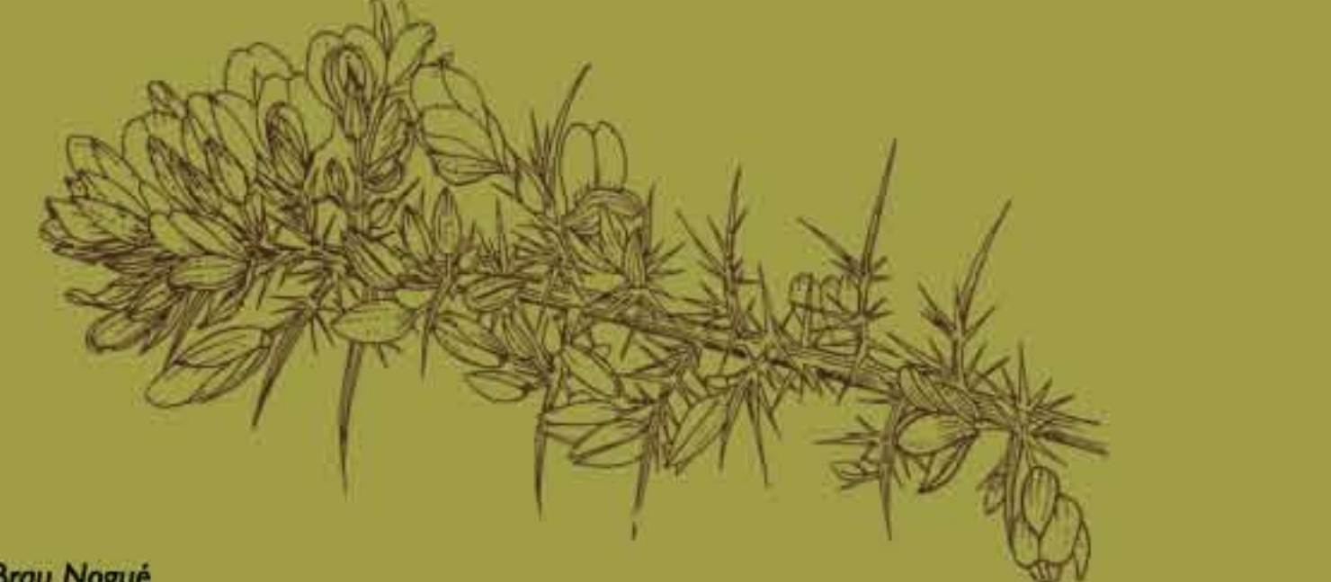
C. Brau Nogué

Fleurs jaunes vif, printemps et début été. Fortes épines à la base des rameaux. Hauteur : 50 cm à 1,50 m.