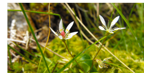
Saxifrage étoilé / AREMIP