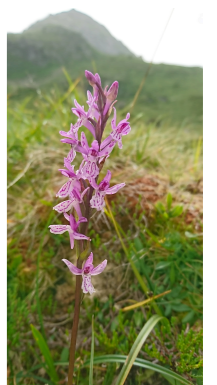
Orchis tacheté W. Lesniak / CCPVG