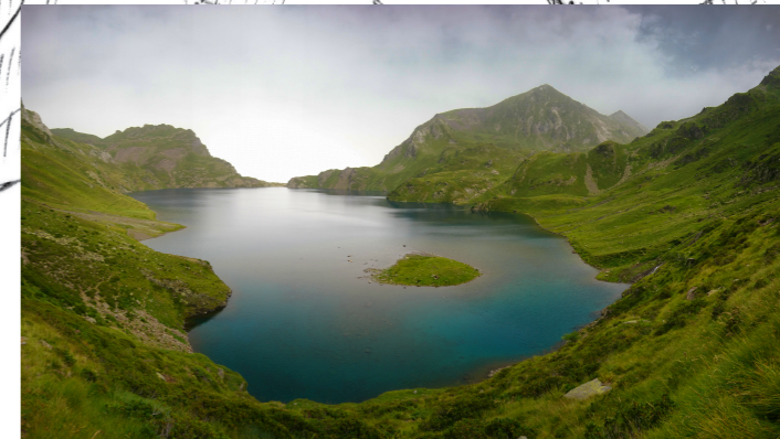
Le lac Bleu