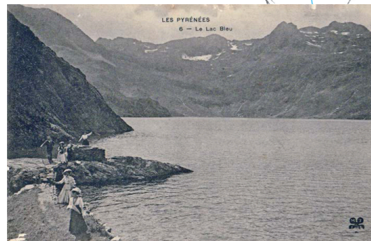
J'ai toujours été très prisé pour des excursions (ici entre 1903 et 1910)