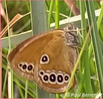
25 juin 2022 Femelle 2