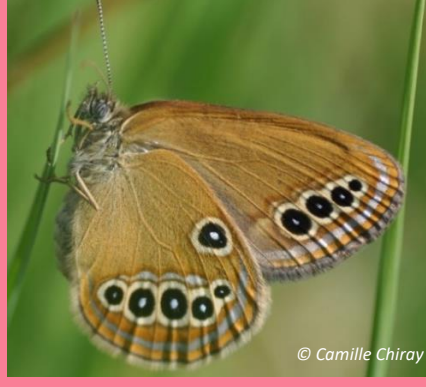
17 juin 2022 Femelle 2