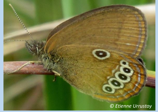
21 juin 2022 Mâle 1