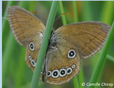
1 er juillet 2022 Mâle 7