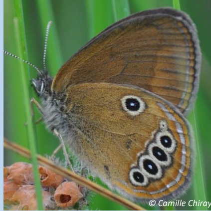
21 juin 2022 Mâle 3