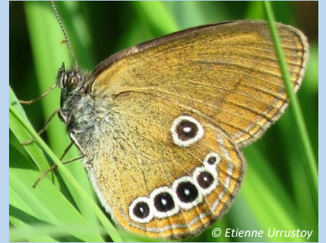
29 juin 2022 Mâle 6