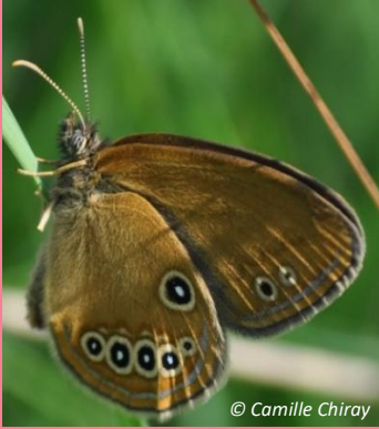
15 juin 2022 Femelle 1