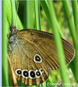
29 juin 2022 Mâle 5