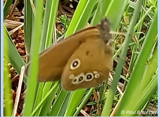
25 juin 2022 Mâle 4