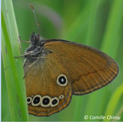
21 juin 2022 Mâle 2