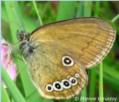
29 juin 2022 Mâle 7