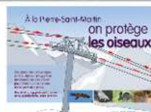
Panneau à adapter à la station