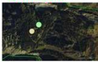
Vue : Nord Masse : à lancer ultérieurement dans un programme massif pour 2012