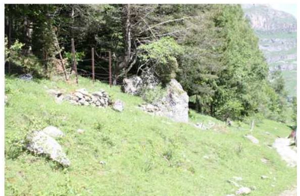
Clôture Est – limite basse : Enlèvement barbelé et piquets