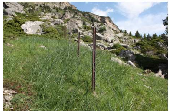
Clôture Sud (partie haute) : Enlèvement barbelé /ONF Remplacement ruban/ CSVB