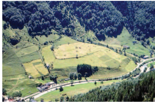
LAVAPOT & CADARS, Prairie de fauche de Gavarnie

Achillea millefolium Bellis perennis Chaerophyllum aureum Cruciata laevipes Trisetum flavescens Rhinanthus alectorolophus Heracleum sphondylium Ranunculus acris Leucanthemum vulgare Dactylis glomerata Conopodium majus Trifolium pratense Viola cornuta Centaurea montana Anthoxanthum odoratum Geranium phaeum Poa trivialis Helleborus foetidus Plantago lanceolata Phyteuma pyrenaicum Alchemilla vulgaris Phleum pratense