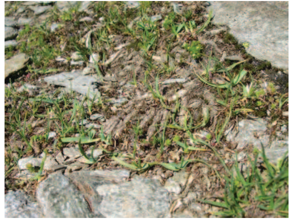
MARTIN D. – Pelouse à Vulpin de Gérard

Pelouse peu dense, souvent rocailleuse et à recouvrement faible comportant beaucoup de plages de sol nu