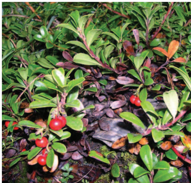
MARTIN D.-Arctostaphylos uva-ursi – Poney Arraby