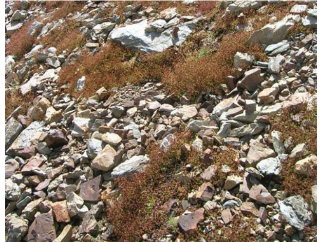
LE MOAL T. – Crête du petite Vignemale

Statut : intérêt communautaire 8130-13 et 8130-16