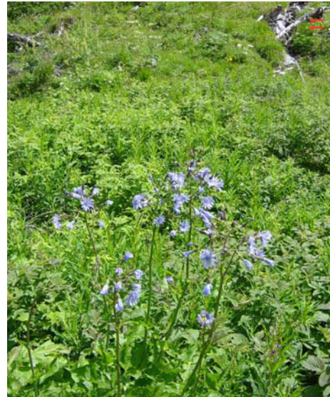
LE MOAL T.- Lac de Gaube