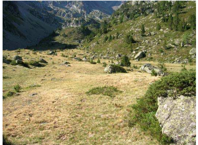
LE MOAL T.- Plateau de Pouey-Trénous

Statut : intérêt communautaire prioritaire – 6230 - si riche en espèces -