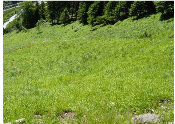
LE MOAL T.- Lita Gran