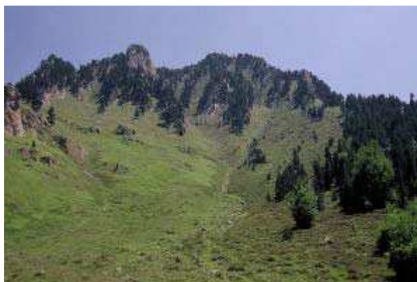
BORGEL J. - Couloirs nord du Pégère

Statut : intérêt communautaire prioritaire 9430 - 12