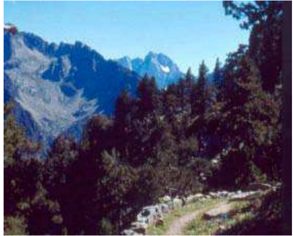
LE MOAL T. - Sentier du Pégùère

Statut : intérêt communautaire – 9430-12