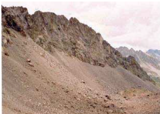
LE MOAL T. – Port du Marcadau

Statut : intérêt communautaire Code UE : 8130-16