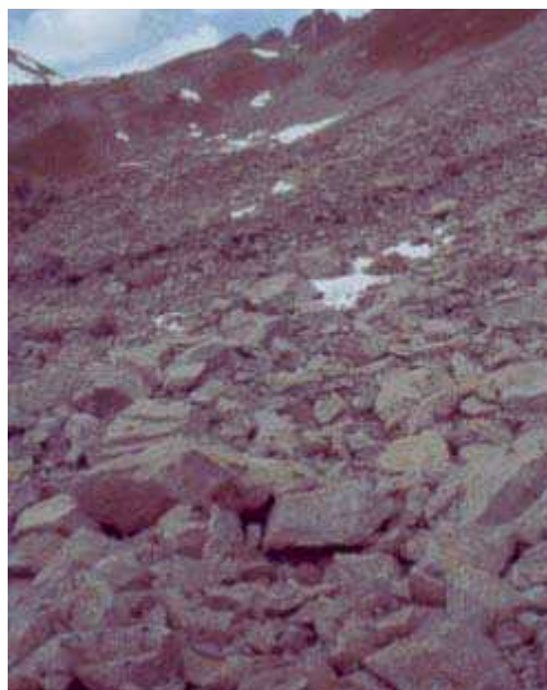
LE MOAL T. - Le Pourtet