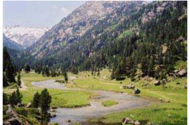
LE MOAL T. - Plateau du Cayan