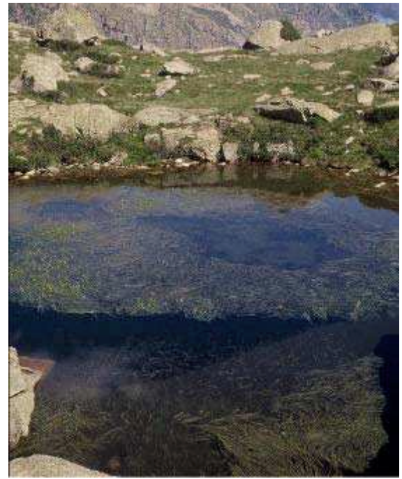
RIVIERE V. - laquette , lac noir de Bassia