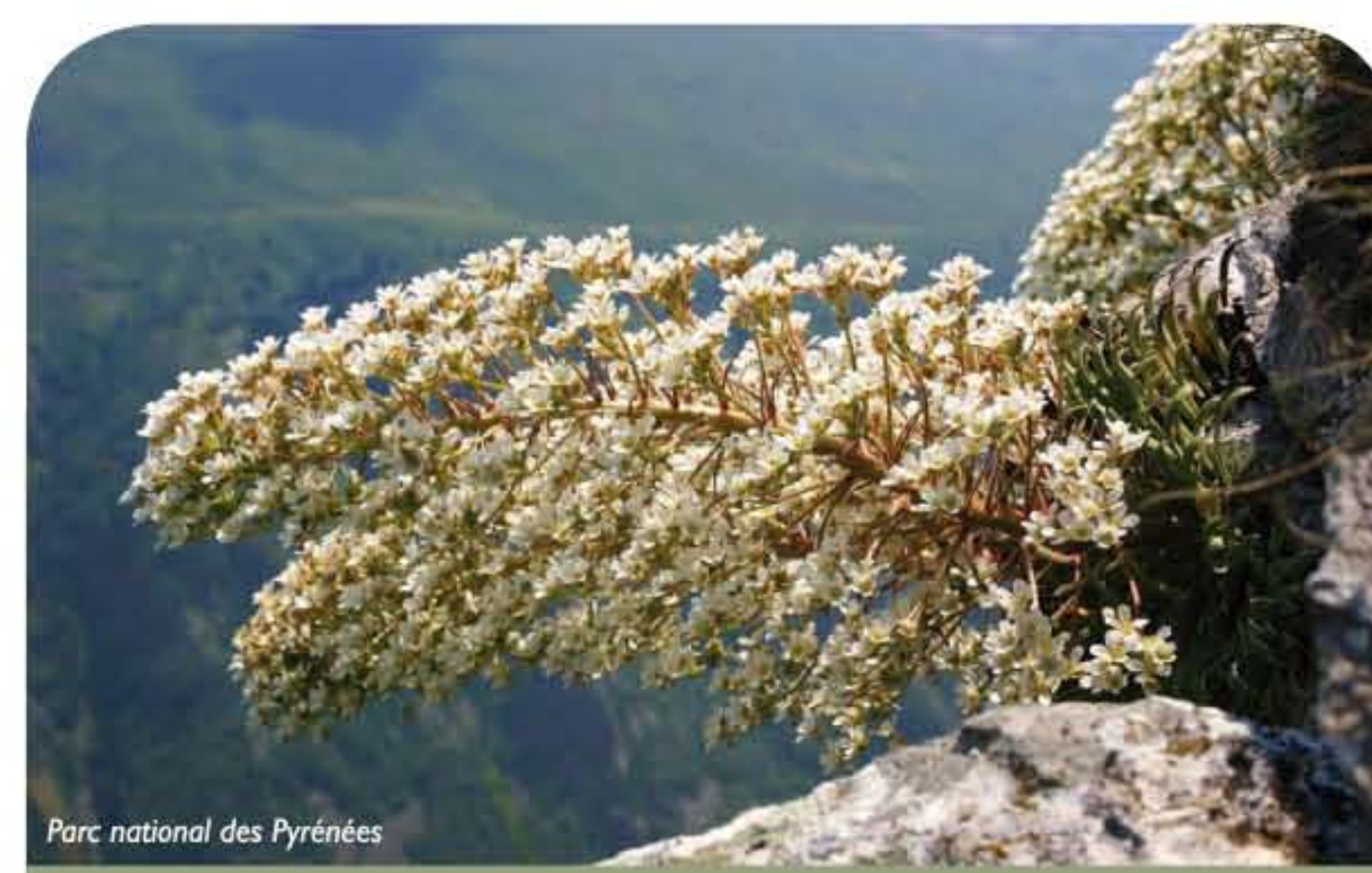
Parc national des Pyrénées