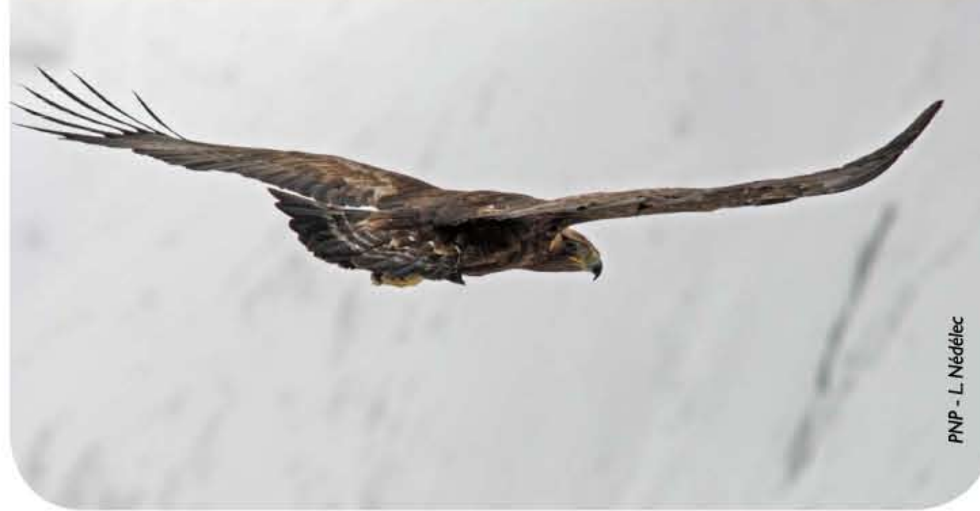
PNP - L. Hédelin

Longtemps considéré comme nuisible et chassé, il est aujourd'hui strictement protégé en France. C'est une espèce prioritaire au niveau européen.