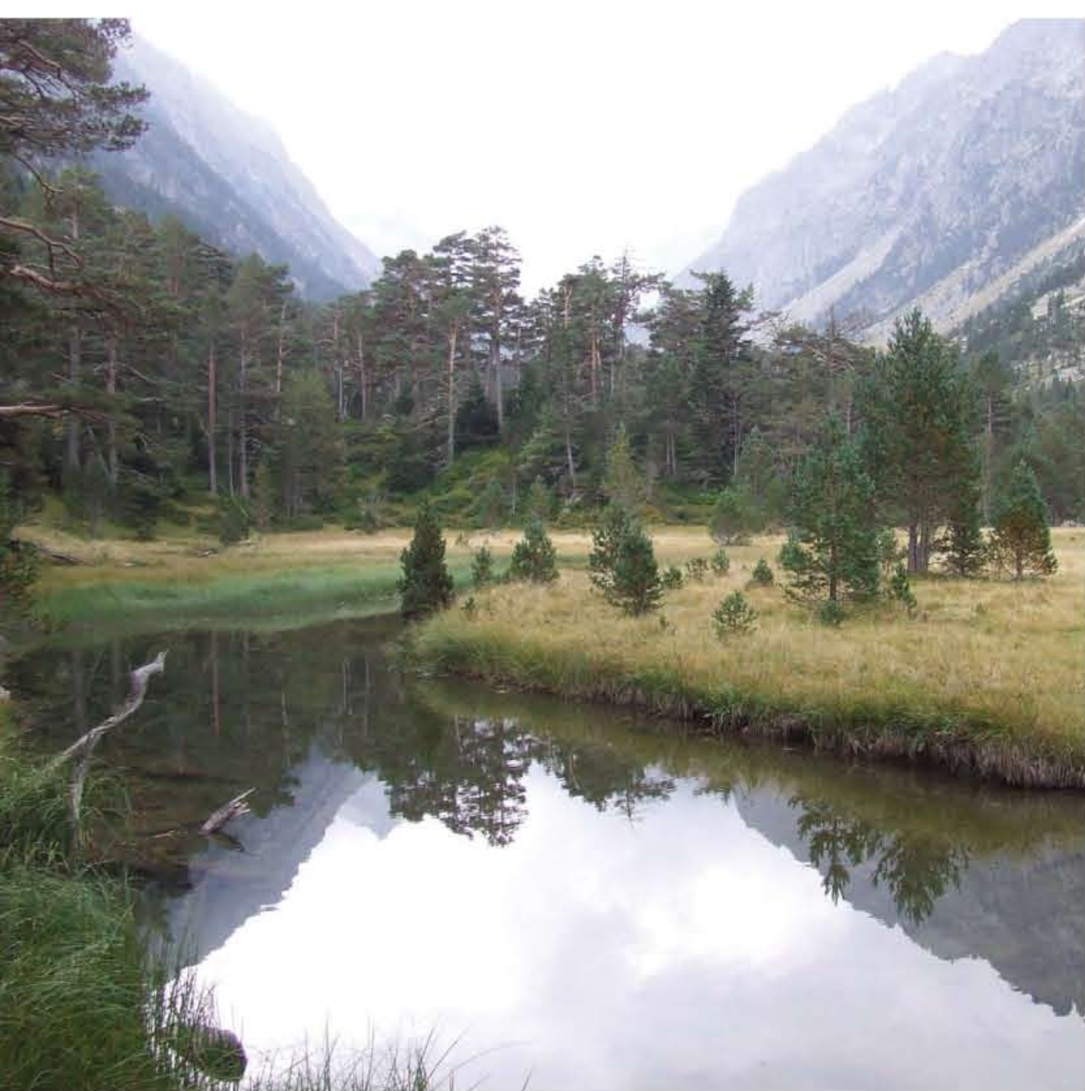
Parc national des Pyrénées