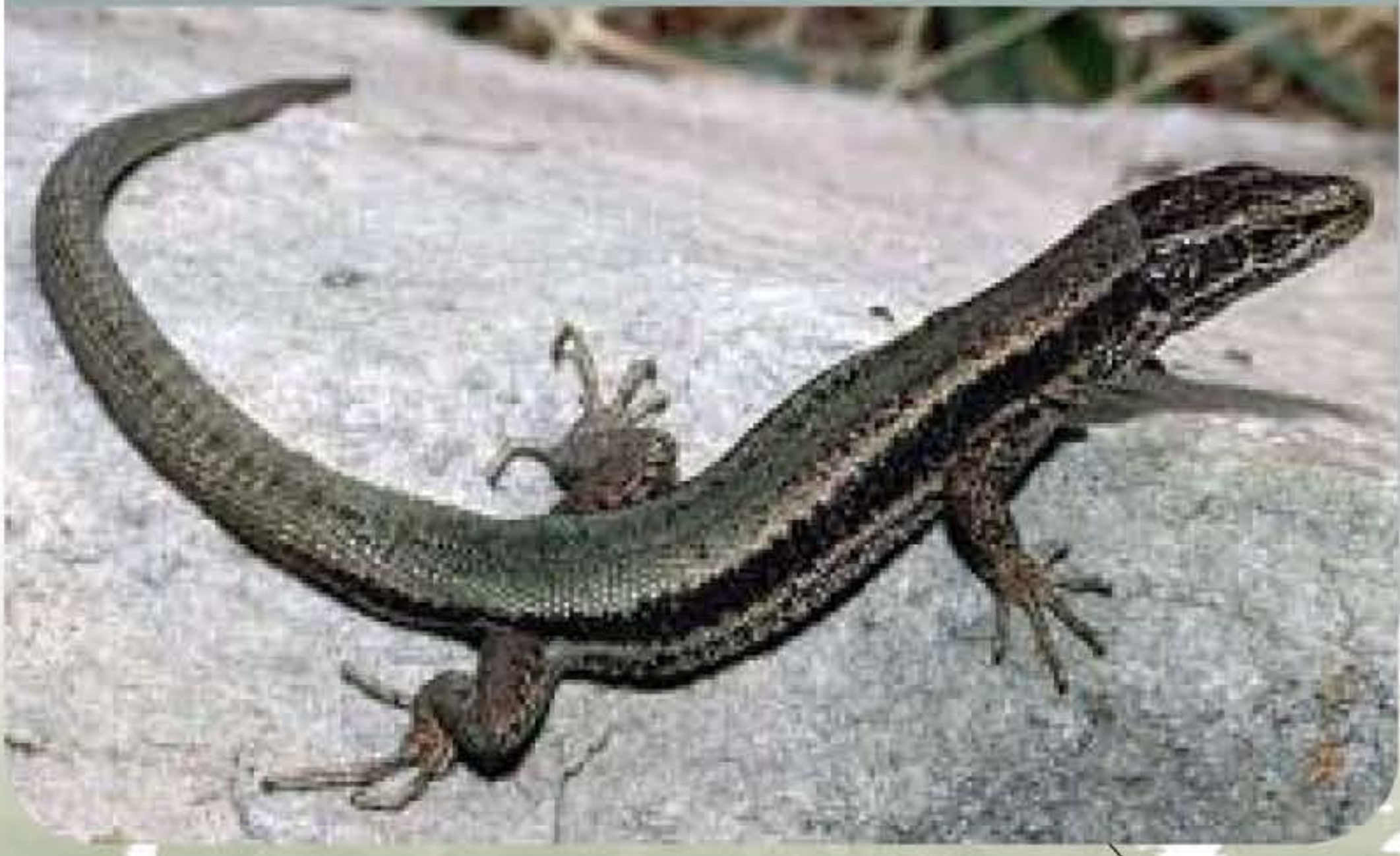
Parc national des Pyrénées

Sur le site, le lézard des Pyrénées a été observé sur le vallon du lac Bleu, au Pène det Pourri et en amont du lac de Lahude.